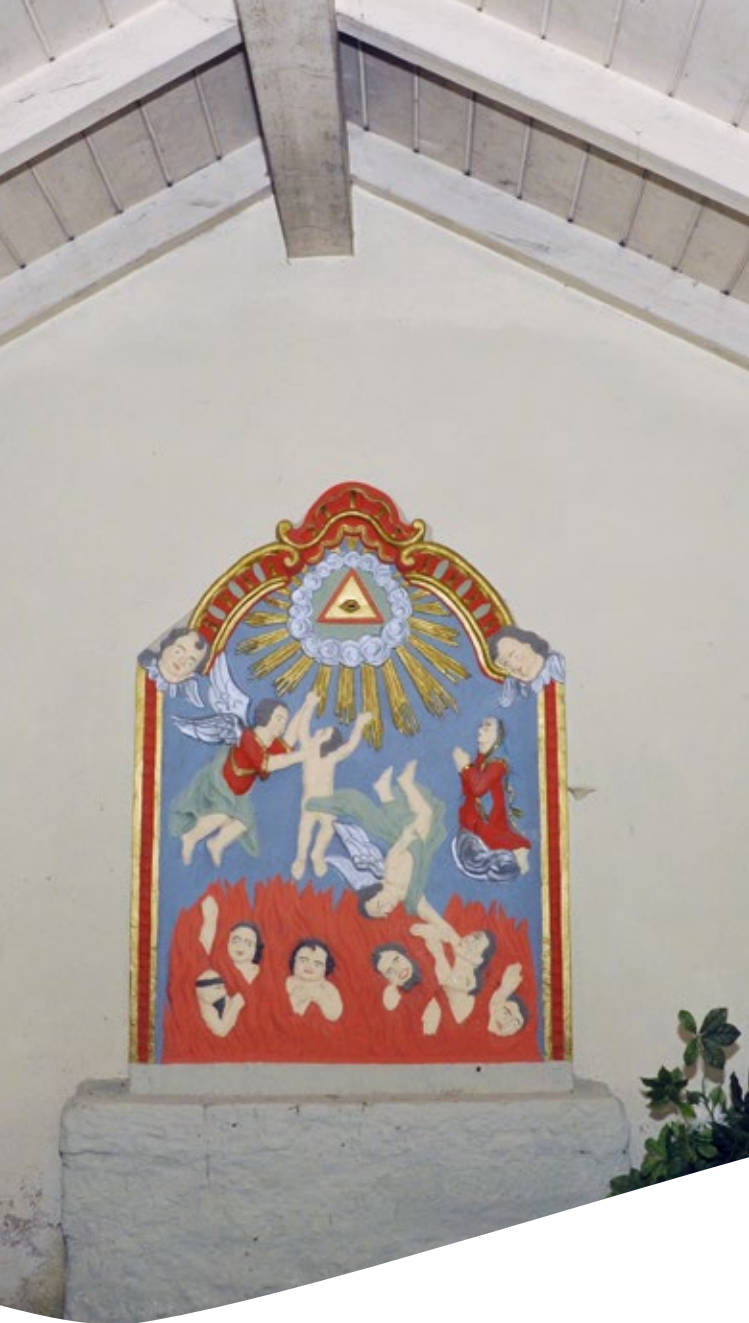
Von Gott getragen ein Leben lang 3. DAS ARMENSEELENHÄUSCHEN