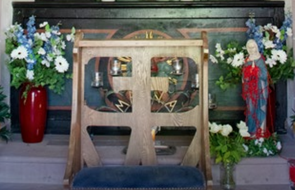
Gott hat Großes an mir getan 2. DIE BATTENSTEINKAPELLE